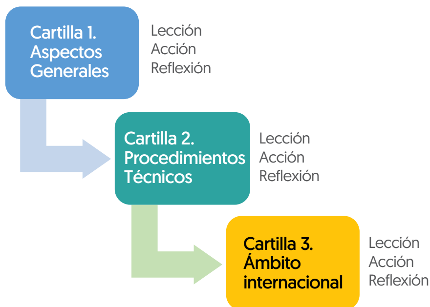
Ilustración 2. Estructura General de las Guías de Aprendizaje Autodirigido en ABP

competencias generales de las Guías de Aprendizaje Autodirigido.